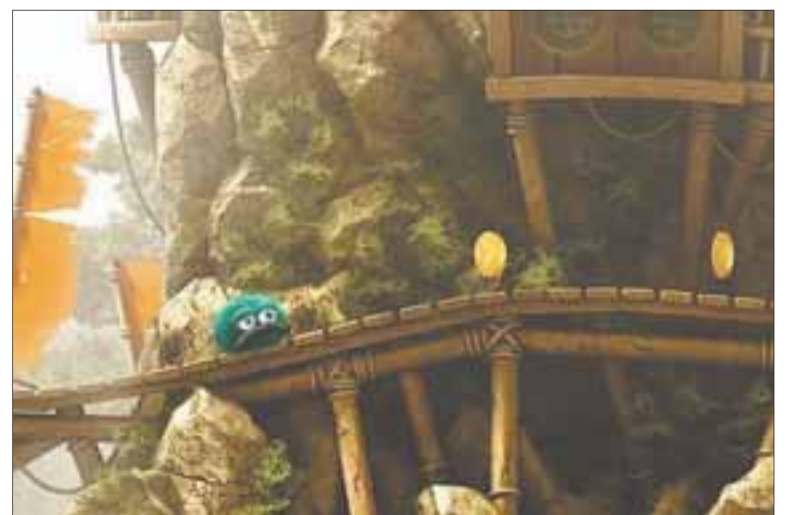
Cada nivel es una enorme y única imagen panorámica.

Leo's Fortune es un juego de plataformas de desarrollo horizontal con 24 niveles realizados de forma casi artesanal, lo que se deja ver en su vistoso apartado gráfico. Cada nivel es una enorme y única imagen panorámica de 50.000 píxeles de ancho. Además, su banda sonora original está muy cuidada y las escenas intermedias interpretadas con voz en off por actores reales.